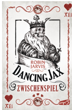
Dancing Jax – Zwischenspiel