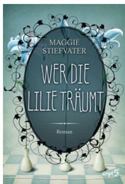
Wer die Lilie träumt (Band 2)