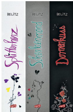
Splitterherz, Scherbenmond, Dornenkuss – Die komplette Trilogie