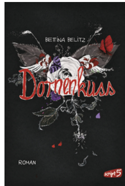
Splitterherz – Dornenkuss