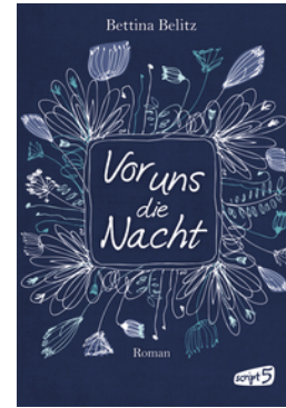
Vor uns die Nacht