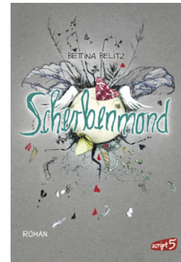
Splitterherz – Scherbenmond