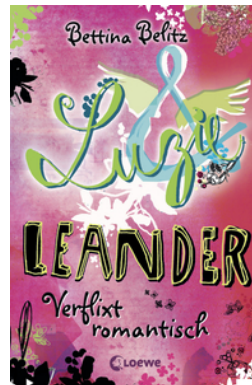
Luzie & Leander - Verflixt romantisch