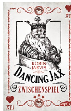
Dancing Jax – Zwischenspiel