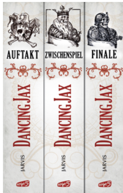
Dancing Jax - Die komplette Trilogie