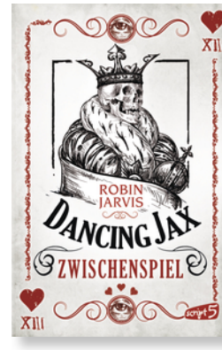
Dancing Jax – Zwischenspiel