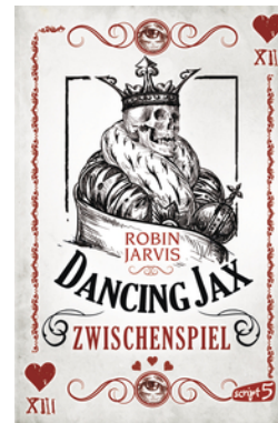
Dancing Jax – Zwischenspiel