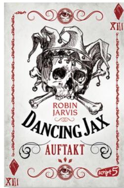
Dancing Jax – Auftakt