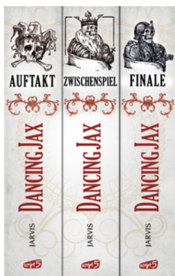
Dancing Jax - Die komplette Trilogie