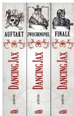
Dancing Jax - Die komplette Trilogie