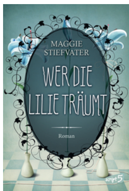
Wer die Lilie träumt (Band 2)