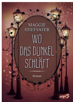
Wo das Dunkel schläft (Band 4)