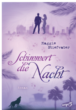
Schimmert die Nacht