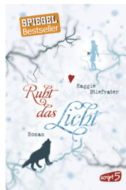
Ruht das Licht