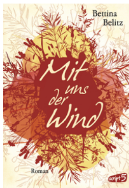
Mit uns der Wind