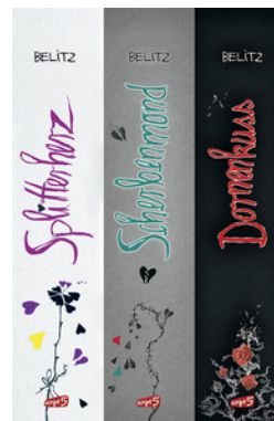
Splitterherz, Scherbenmond, Dornenkuss – Die komplette Trilogie