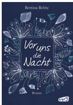
Vor uns die Nacht