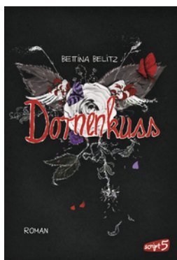
Splitterherz – Dornenkuss