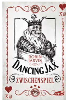
Dancing Jax – Zwischenspiel