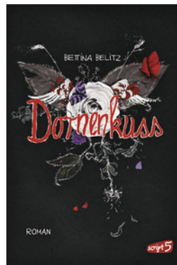
Splitterherz – Dornenkuss