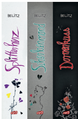
Splitterherz, Scherbenmond, Dornenkuss – Die komplette Trilogie