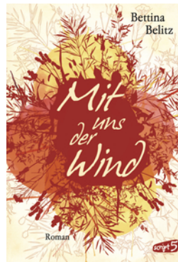
Mit uns der Wind