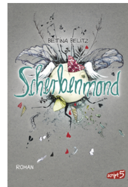
Splitterherz – Scherbenmond