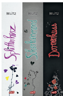
Splitterherz, Scherbenmond, Dornenkuss – Die komplette Trilogie