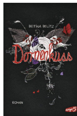
Splitterherz – Dornenkuss