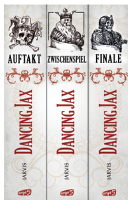
Dancing Jax - Die komplette Trilogie