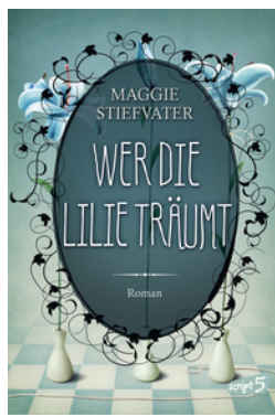
Wer die Lilie träumt (Band 2)