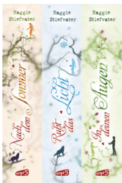
Nach dem Sommer/Ruht das Licht/In deinen Augen