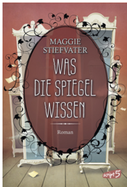
Was die Spiegel wissen (Band 3)