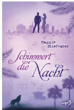
Schimmert die Nacht