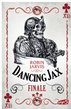
Dancing Jax – Finale