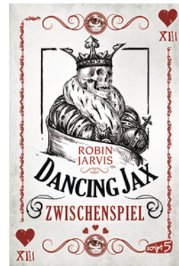
Dancing Jax – Zwischenspiel