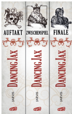
Dancing Jax - Die komplette Trilogie