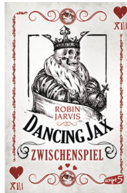
Dancing Jax – Zwischenspiel