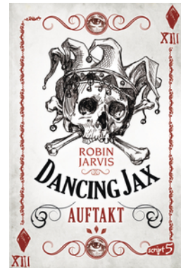
Dancing Jax – Auftakt