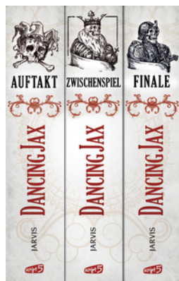
Dancing Jax – Die komplette Trilogie