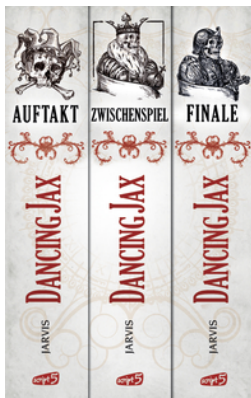
Dancing Jax - Die komplette Trilogie