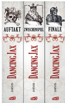
Dancing Jax - Die komplette Trilogie