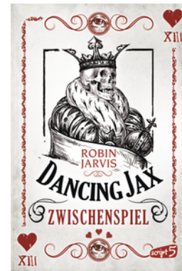
Dancing Jax – Zwischenspiel