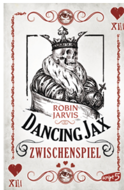
Dancing Jax – Zwischenspiel