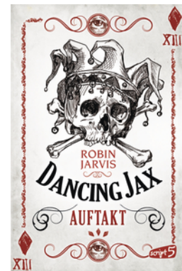
Dancing Jax – Auftakt