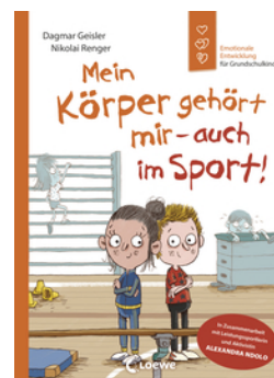
Mein Körper gehört mir - auch im Sport! (Starke Kinder, glückliche Eltern)