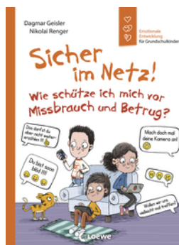
Sicher im Netz! Wie schütze ich mich vor Missbrauch und Betrug? (Starke Kinder, glückliche Eltern)