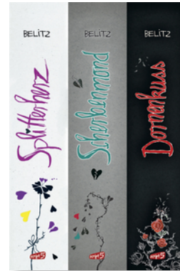
Splitterherz, Scherbenmond, Dornenkuss – Die komplette Trilogie