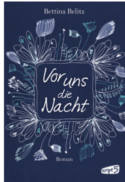
Vor uns die Nacht