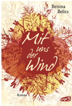
Mit uns der Wind