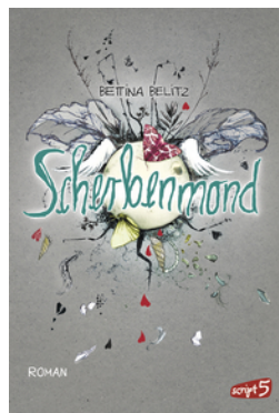
Splitterherz – Scherbenmond