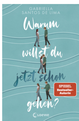
Warum willst du jetzt schon gehen?