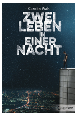
Zwei Leben in einer Nacht