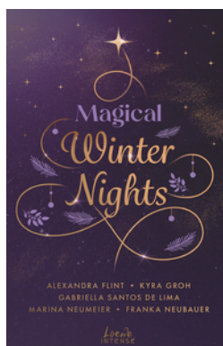
Magical Winter Nights