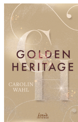
Golden Heritage (Crumbling Hearts, Band 2)