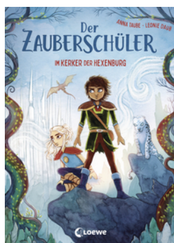
Der Zauberschüler (Band 5) - Im Kerker der Hexenburg