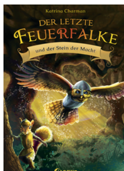
Der letzte Feuerfalk und der Stein der Macht (Band 1)