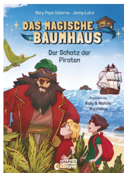
Das magische Baumhaus (Comic-Buchreihe, Band 4) - Der Schatz der Piraten