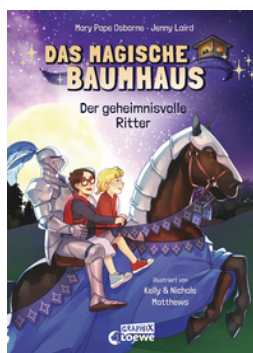
Das magische Baumhaus (Comic-Buchreihe, Band 2) - Der geheimnisvolle Ritter