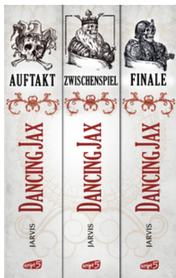
Dancing Jax - Die komplette Trilogie