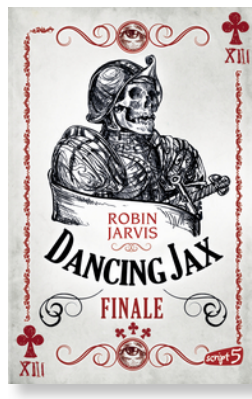
Dancing Jax – Finale