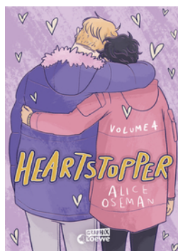
Heartstopper Volume 4 (deutsche Hardcover-Ausgabe)