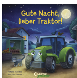
Gute Nacht, lieber Traktor!