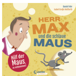
Herr Max und die schlaue Maus