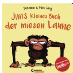
Jims kleines Buch der miesen Laune