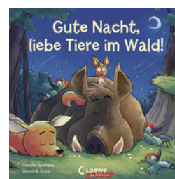
Gute Nacht, liebe Tiere im Wald!