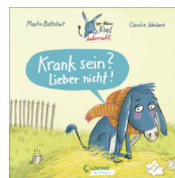
Der kleine Esel Lieber nicht - Krank sein? Lieber nicht!