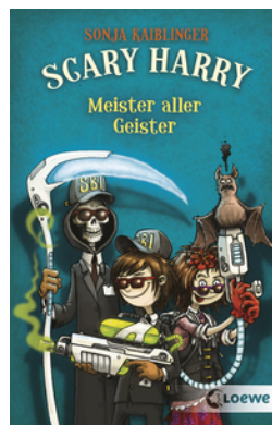
Scary Harry (Band 3) - Meister aller Geister