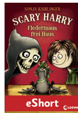
Scary Harry - Fledermaus frei Haus