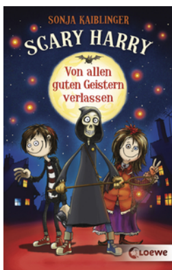
Scary Harry (Band 1) - Von allen guten Geistern verlassen