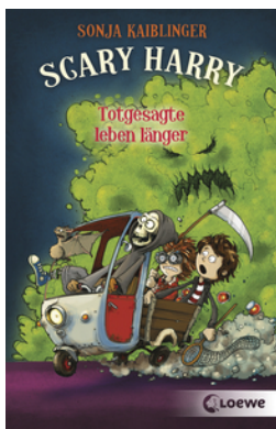
Scary Harry (Band 2) - Totgesagte leben länger